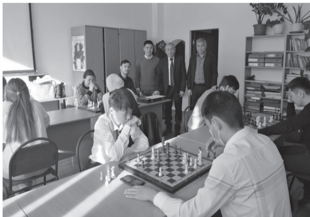
Шахмат ойынынан көрініс

Атап айтар болсақ, шахмат ойыны дәстүрінің бірден-бір ерекшелігі жастардың ой-өрісін арттыруға, ойлау қабілеттерінің ерекшеленуіне көптен-көп ықпалы болатынына сенімдіміз. Осындай Республикалық деңгейдегі олимпиадалық жарыстардың ерекшелігі, мектеп бітіруші 11-ші сынып оқушыларын жүйелі түрде жарысқа шақыру, олимпиада және шахматтан өткен турнирлер университетіміздің абыройын асқақтатып, физика-техникалық факультеттің, соның ішінде жылуфизика және техникалық физика кафедрасының дайындайтын мамандықтарына: техникалық физика, жылу энергетикасы